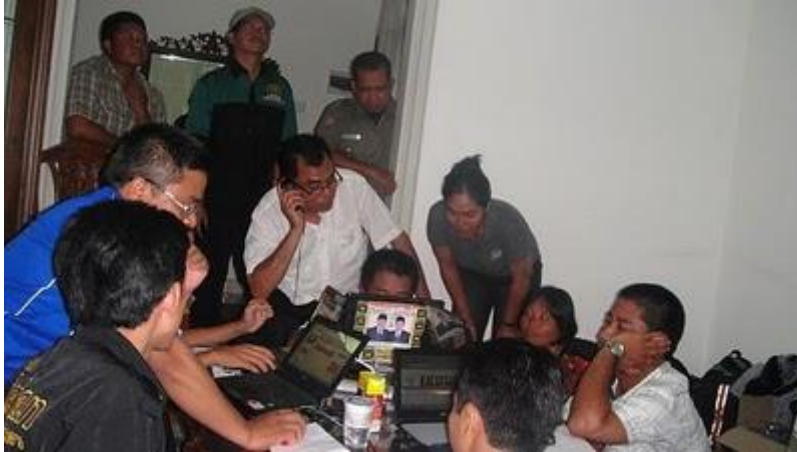
Foto nontong Bareng di Luar ruangan Media Center untuk Konsumsi Publik (jika di perlukan)